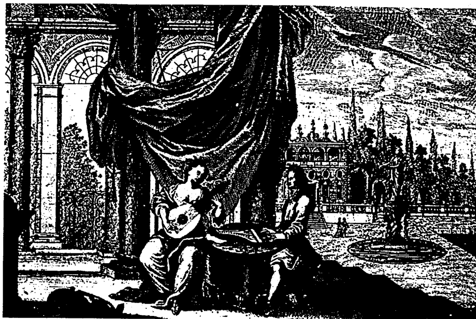
Ms 40150: Vorsatzblatt 3

Im Unterschied zu den Eingriffen in der Lautentabulatur ließen sich in der Violinstimme aufgrund von Beobachtungen der Schrift von Friedrich Wilhelm Rust, die an andern, nicht bearbeiteten Autographen 16 gewonnen werden konnten, mit relativ großer Wahrscheinlichkeit