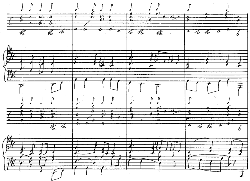
Beispiel 3: Takte 1-4 des 2. Satzes aus der ersten Sonate: oben MS 40150 mit Übertragung, unten Rust 53 mit Übertragung

weshalb und von wem Rust 53 bearbeitet wurde. Falls, wie von Wilhelm Rust in der eingangs zitierten Notiz behauptet, der Lautenspieler Friedrich Wilhelm Rust die Korrekturen in Rust 53 vorgenommen haben sollte, wären seine vielen Schreibfehler innerhalb dieser Korrekturen nicht verständlich: Die Fehler bestehen zumeist aus der Verwechslung von Chören, das heißt derjenigen Linien, die für die sechs Spielchöre stehen. So wurde zum Beispiel einmal der Tabulaturbuchstabe d, der 'Greifen am 3. Bund' bedeutet, statt auf der 6. Linie, die dem 6. Chor entspricht (ungegriffen ein A), auf der 5. Linie (= d) eingetragen, wodurch aus dem beabsichtigten c ein f wird. Diese Art von Fehler und besonders deren Häufigkeit weist darauf hin, daß jemand korrigierte, der die Tabulatur nur theoretisch gekannt hat und diese nicht durch das Spielen auf das Griffbrett umsetzen mußte.