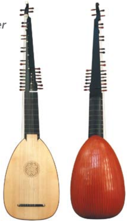
Englische Theorbo / English Theorbo Rekonstruktion nach / reconstruction after Talbot und Mace Spiellensur 78, Bässe bis 135 cm