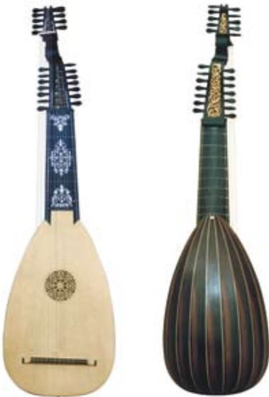
13-chörige Barocklaute mit Schwanenhals 13-course Baroque Lute with swan neck nach / after Leopold Widhalm, 1755 Spiellensur 74 cm, Bässe 99 cm