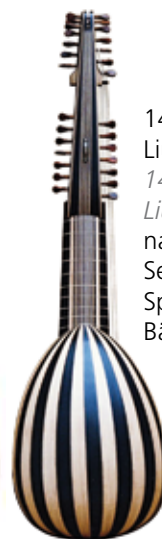
14-chöriger Liuto attiorbato 14-course Liuto attiorbato nach / after Matteo Sellas, 1637 Spielmensur 64 cm, Bässe 93 cm