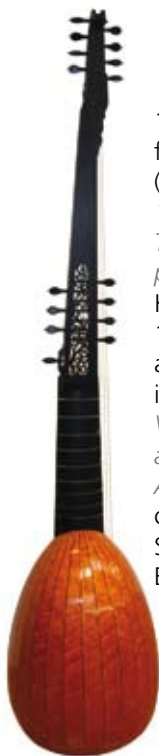
14-chörige französische Theorbe (Théorbe de pièces) 14-course French Theorbo (Théorbe de pièces) Korpus nach Venere 1582, Hals nach der anonymen Angélique in Paris / body after Venere 1582, neck after the anonymous Angélique in Paris, ca.1685 Spielmensur 72 cm, Bässe 128 cm