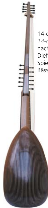
14-chörige Theorbe 14-course Theorbo nach / after Magno Dieffenpruchar, 1608 Spielmensur 93 cm, Bässe 170 cm