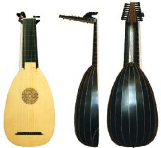
13-chörige Barocklaute mit Bassreiter 13-course Baroque Lute with bass rider nach / after Thomas Edlinger, ca.1715 Spiellensur 77.5 cm, Bässe 82 cm