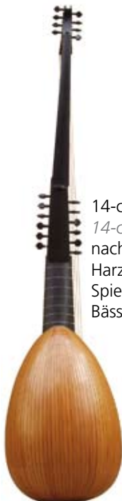
14-chöriger Arciliuto 14-course Archlute nach / after Martinus Harz, 1665 Spielmensur 67, Bässe 144 cm