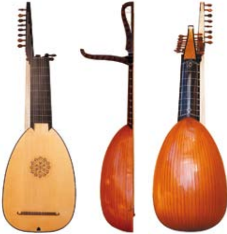
12-chörige Laute mit Doppelwirbelkasten 12-course Double Headed Lute nach / after Magno Dieffopruchar, 1609 Spiellensur 67 cm, Bässe bis 89 cm